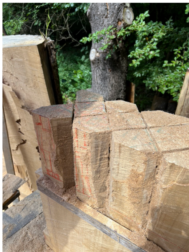
Grobe Aufteilung/Platzierung nach Plan