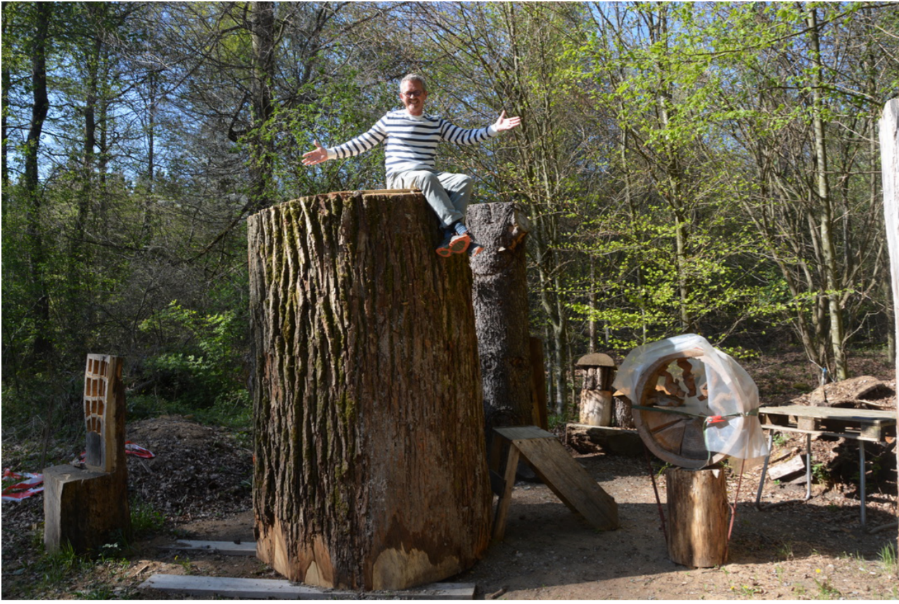
Freude herrscht! Aber wie bearbeite ich den überhaupt?