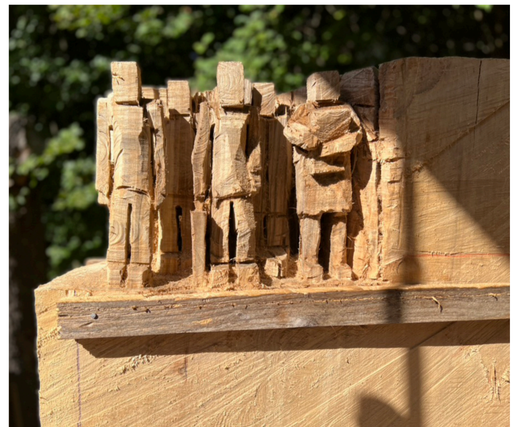
Der Anfang ist gemacht