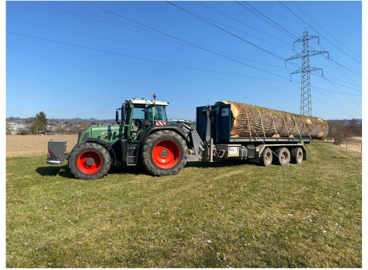
Sorgfältig und mit viel Erfahrung wird der Riese aus dem Naturschutzgebiet geborgen.