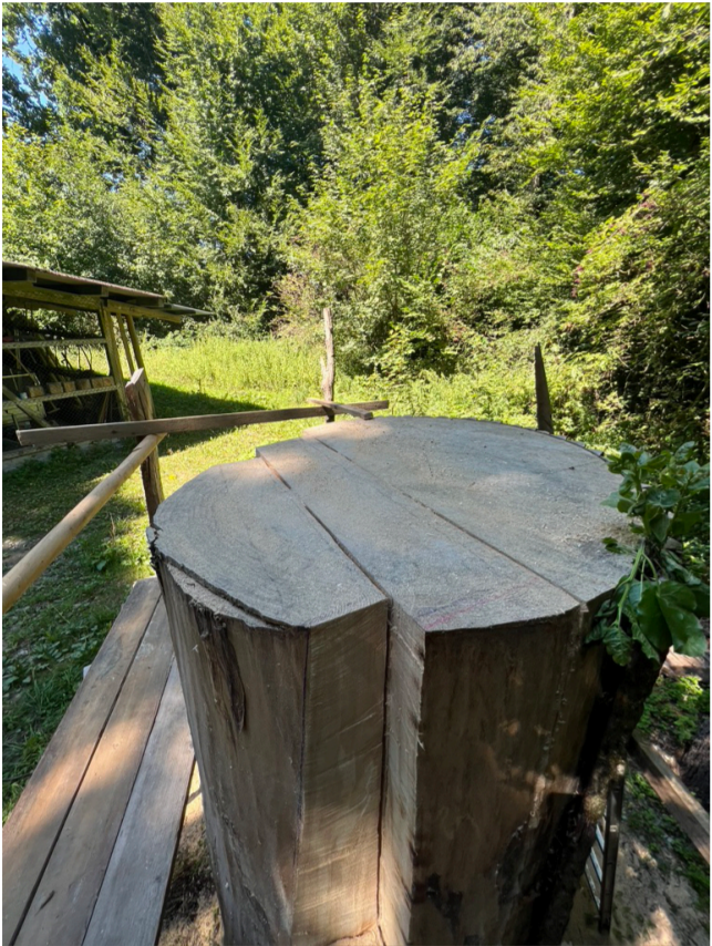
Planen der Aufteilung