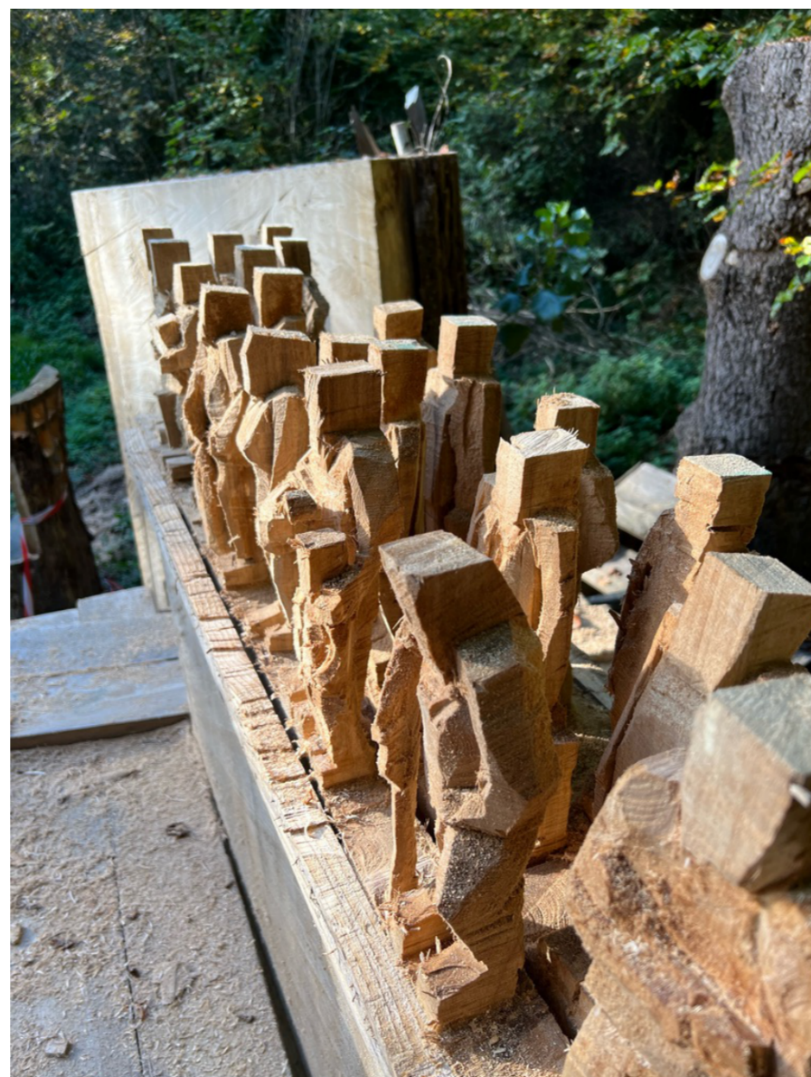
Mehr als 20 Menschen auf der Mauer