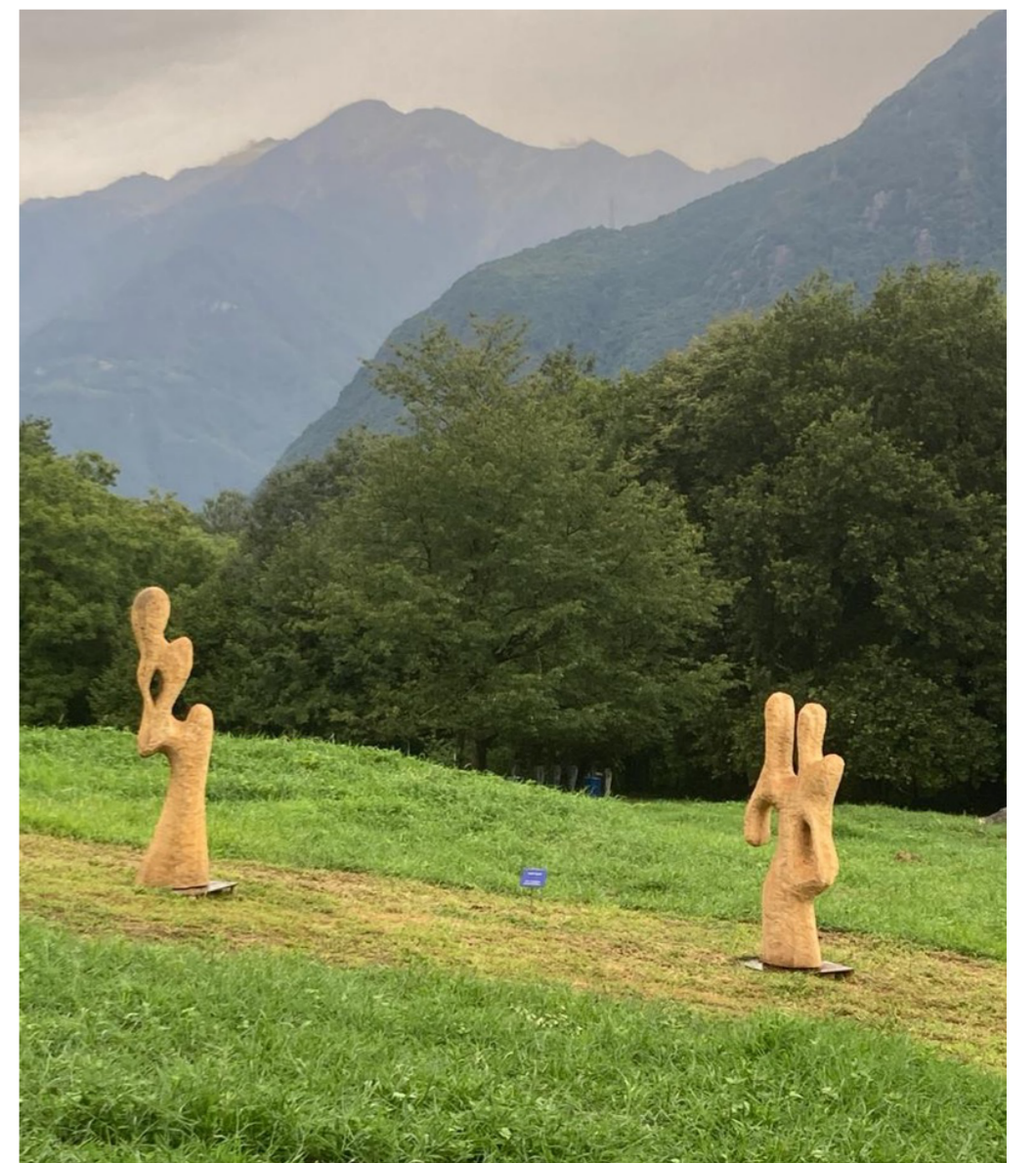
Werke von Noldi Vogler an der Kunstausstellung Roveredo /Ti