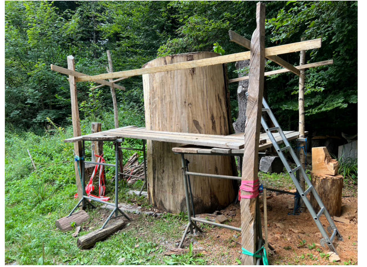
Bei der Grösse/Höhe braucht es ein Gerüst