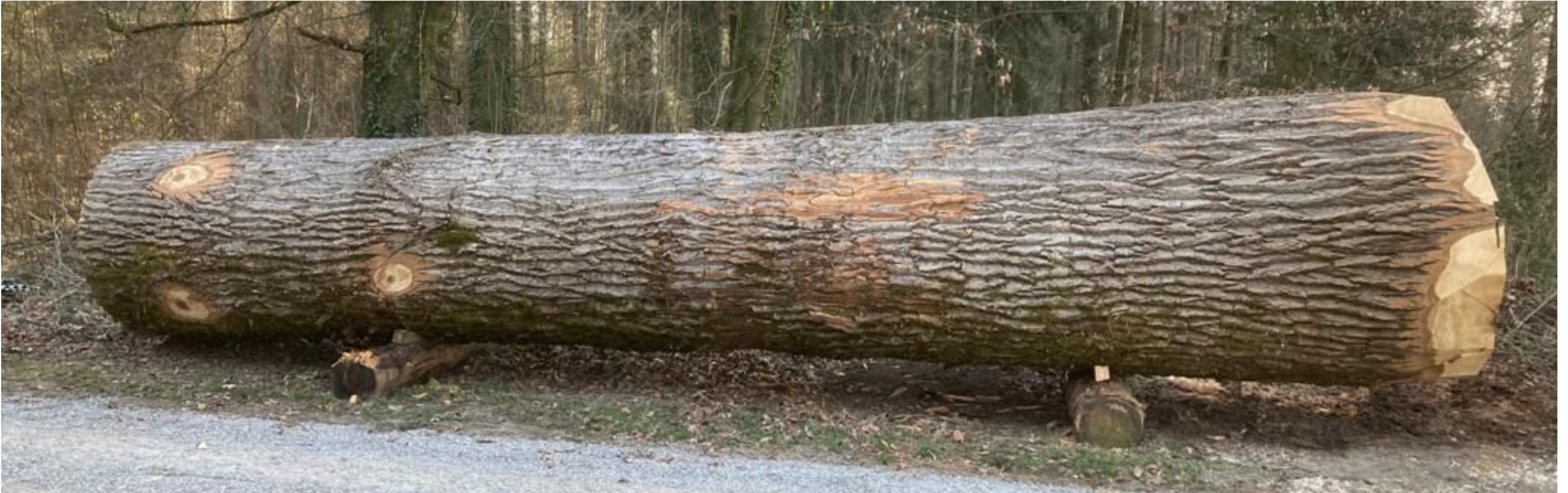
11 Meter lang, bis zu 170 cm Durchmesser und über 10 Tonnen schwer - eine logistische Herausforderung