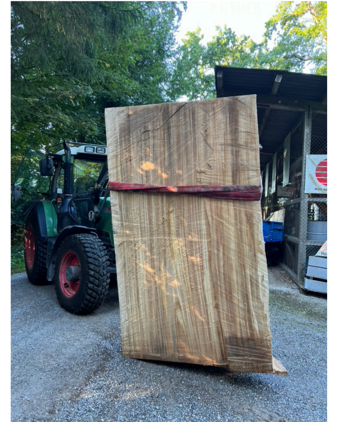
..und beim platzieren