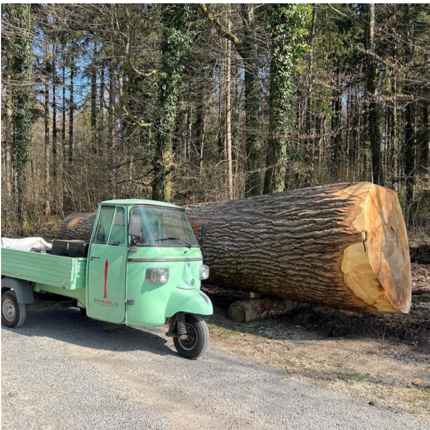
Mein Werkauto wirkt daneben wie ein Spielzeugfahrzeug