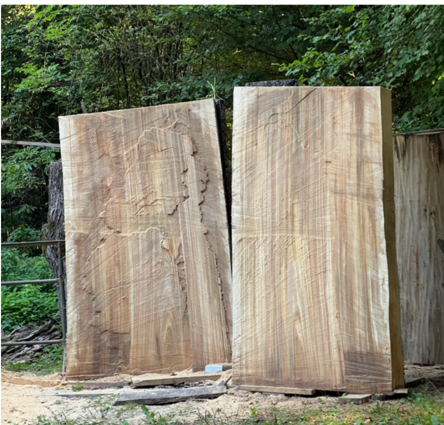
Frisch aufgeschnittener 170cm Stamm!