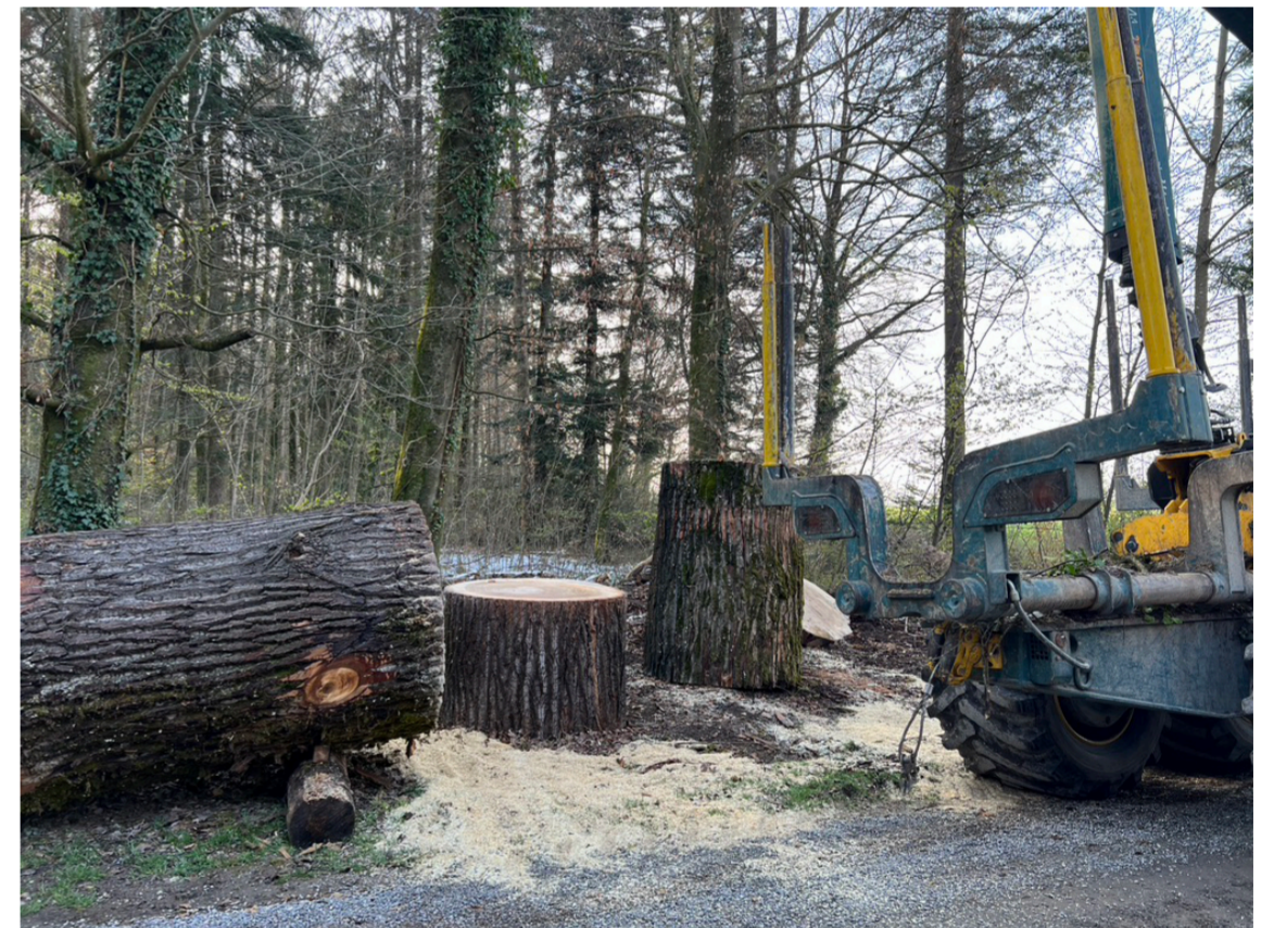
„Baum-Teilet“ für die verschiedenen, beteiligten Künstler